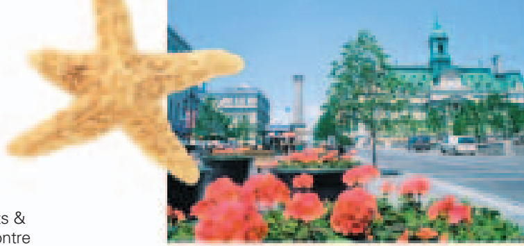
Old Montréal, Québec

Des privilèges exclusifs et le statut VIP. En tant que membre HHonors, vous profitez d'une foule de services et de commodités conçus spécialement pour vous. De plus, lorsque vous séjournez fréquemment à titre de membre HHonors, vous profitez d'avantages additionnels, y compris